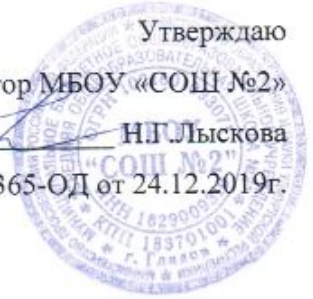
График приема документов от заявителя в МБОУ «СОШ №2»