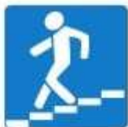
Знак 6.6. Подземный пешеходный переход