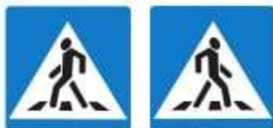
Знаки 5.19.1 и 5.19.2 Пешеходный переход

Если нет подземного или надземного пешеходного перехода, можно перейти по наземному пешеходному переходу